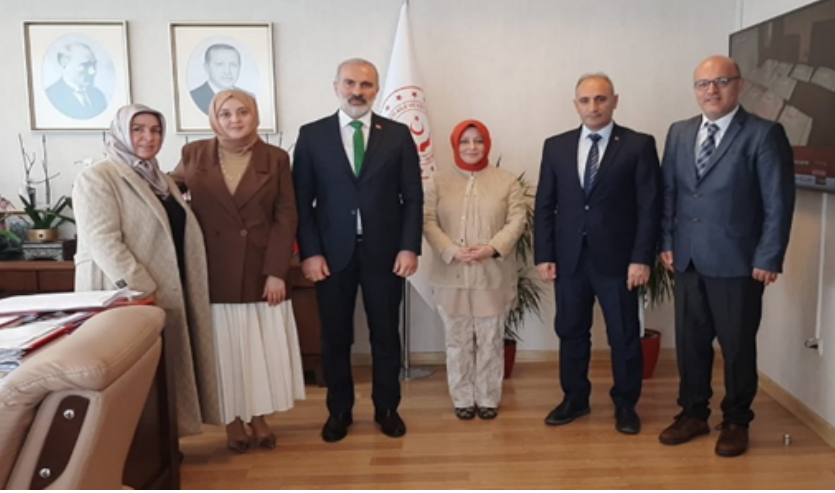
Çocuk Hizmetleri Genel Müdürü Ayşegül Yıldırım KARA

Görüşmelerimizde ülkemizin mevzuattan ziyade uygulama noktasında sıkıntılar yaşandığı hususu belirtilmiştir. Uygulamanın güçlendirilmesi, etkili ve verimli bir şekilde yürütülmesi amacıyla çocuğun yüksek yararı esaslı bir mevzuat yapısının oluşturulması talep edilmiştir. Kurumsal bakım hizmetlerinde çalışan tüm personele yönelik özel bir personel kanunu hazırlanması gerektiğinden bahsedilmiştir.