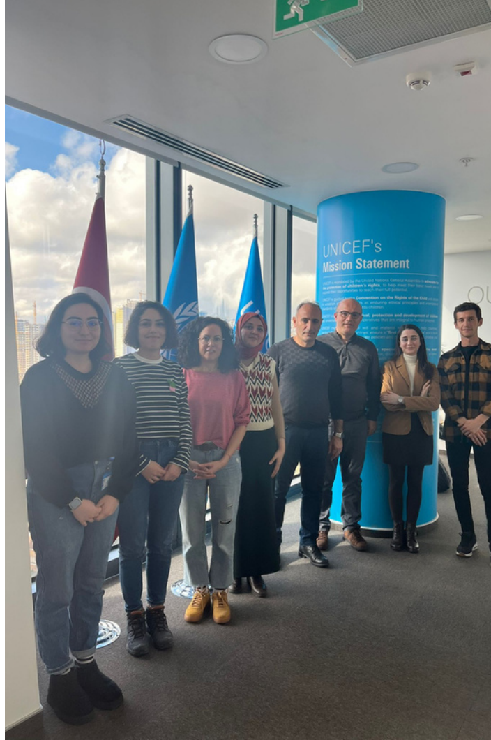
UNICEF Türkiye Ofisi Ekibi

Toplantıda derneklerimizin çalışma ve kuruluş amaçlarından bahsederek çalışmamızın kapsamı anlatılmıştır. Etkiniz AB Programı desteği kapsamında hazırladığımız "Kurumsal Bakım Süreci ve Sonrasında İnsan Hakları İhlalleri Raporundan" bahsedilerek raporumuzu BM Çocuk Hakları Komitesine gönderdiğimi ve 93. Oturumunda Çocuk Hakları Komitesinin raporumuzu da içeren ülkemize yönelik tavsiye kararlarından bahsedilmiştir.