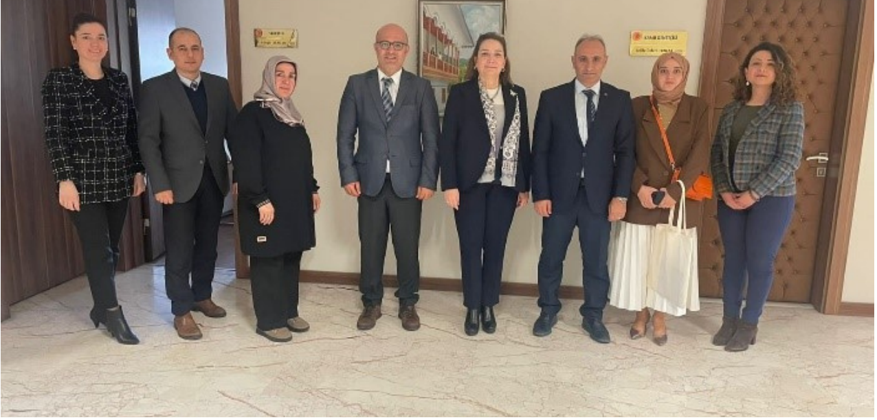
Kamu Denetçisi Celile Özlem TUNÇAK

Kamu Denetçiliği Kurumunda özellikle Çocuk Ombudsmanlığı çalışmaları da bulunan, bu konuda yetkin olan Kamu Denetçisi Celile Özlem TUNÇAK hanımefendi ile ilgili birimin uzmanlarının da katıldığı geniş katılımlı bir toplantı gerçekleştirilmiştir.